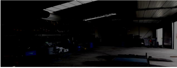
Fig 2. Service auto din Timișoara

Datorita unui incendiu trei angajați sau intoxicați cu fum, iar unul a făcut atac de panică. Rezervorul, în care se aflau o sută de litri de ulei, a ars ca o tortă, iar flăcările au cuprins imediat pereții clădirii. În momentul în care a izbucnit incendiul, în încăperea erau șapte angajați.