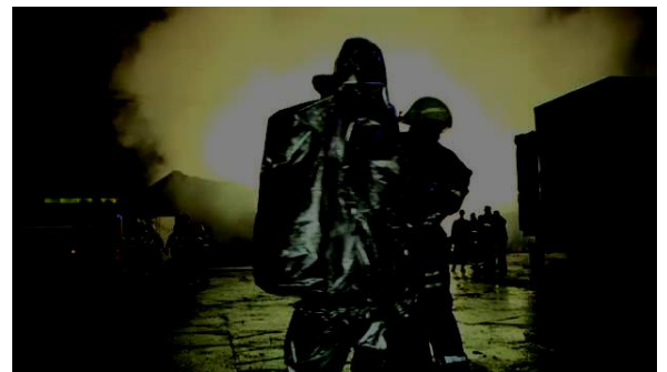
Fig. 1 Fabrica de piese auto din Brașov

Datorita unui gaz necunoscut 43 de muncitori au fost duși la spital iar alte cateva sute de oameni au fost evacuați din hale. Inspectoratul pentru Situații de Urgență (ISU) Brasov si Serviciul Județean de Ambulanta au instituit "planul roșu" in cazul intoxicățiilor de la fabrica Autoliv din localitatea Prejmer. Acest lucru face referire la intoxicarea profesionala.