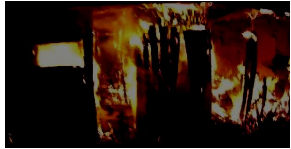
Fig 5. Service auto Rădăuți

Un puternic incendiu a izbucnit la acoperișul unui service auto din municipiul Rădăuți, la fața locului intervenind numeroase echipaje de pompieri, cu opt autospeciale cu apă. Focul a izbucnit la SC Autoservice SRL Rădăuți. Pompierii au găsit la fața locului un incendiu care se manifesta la astereala acoperișului și la instalația de încălzire, existând pericolul de propagare la întreaga hală. Flăcările au distrus astereala din lemn, pe 50 de metri pătrați, un generator de aer cald, precum și elemente combustibile din tabloul electric al generatorului și un cric pneumatic. Flăcările au degradat pereții clădirii pe o suprafață de 250 de metri pătrați. Cauza probabilă de izbucnire a incendiului a fost efectul termic generat de un aparat electric de încălzire, lăsat sub tensiune.