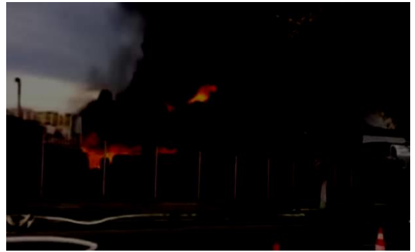
Fig. 4. Fabrica de piese auto din Brașov

Un incendiu de proporții a izbucnit în Cluj-Napoca, la un service auto. O femeie s-a intoxicați cu fum și a avut nevoie de îngrijiri medicale, iar două autoturisme s-au făcut scrum. Flăcările imense s-au văzut de la kilometri depărtare. Incendiul a fost provocat de un scurtcircuit produs la o mașină parcată în apropierea unui morman de cauciucur. Angajații depozitului au încercat să stingă flăcările, dar focul s-a extins rapid și situația a scăpat de sub control. Focul a fost stins după ce pompierii au intervenit cu mai multe autospeciale.