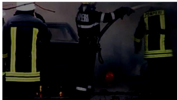
Fig 8. Service auto Campulung Moldovenesc

Flăcările s-au extins și la garajul unui vecin și au distrus o altă mașină, dar și la un alt autoturism parcat într-o altă curte. Prima ipoteză în anchetă e aceea că focul a izbucnit din cauza unui cablu supraîncălzit la sistemul electric al service-ului auto.